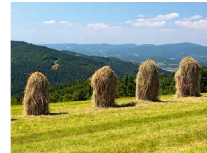
výhled ze Soláně

V celoročně využívaném sportovně zábavním parku v Halenkově je bikerům k dispozici víceúčelové hřiště pro volejbal, tenis a malou kopanou. Kolem něj se v kruzích a smyčkách proplétá in-line dráha, na níž navazuje cyklostezka s cvičnými bikrosovými prvky. V areálu je rovněž lezecká a cvičná stěna, venkovní posezení s grilovací plochou a ohništěm, atrakce pro děti, sociální zázemí, venkovní převlékárna, box pro mytí kol a přístřešek na uskladnění kol a lyží. Během zimních měsíců se park využívá jako běžkařská dráha a bruslařské hřiště.