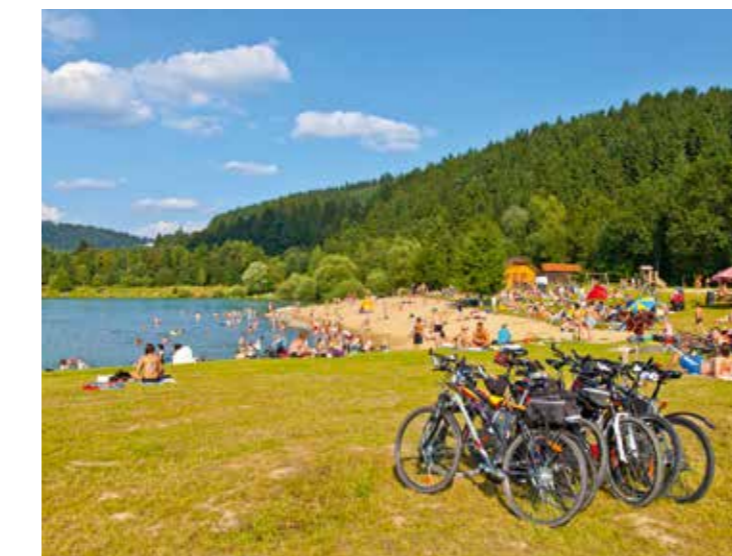
Nový Hrozenkov, jezero Na Stanoch